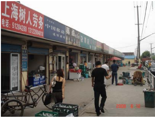
图2 陈家超市所在街道外景 Fig.2 The street where CHEN's shop is on

陈家超市正对场北公寓大门(图2),租用场北镇的铺面,每月租金六万元,扣除其他成本与日常花费,每月收入结余在两三千上下(这家人除超市外还有数笔投资,拥有一辆本田皮卡,儿子的教育投资与本地学龄前儿童相比差异不大,其中幼儿园、幼儿英语辅导班以及没有言明的费用每月高达数千元,整体估算月收入在5000元以上)。超市内部空间呈长条形,营业面积150平方米左右,有四排货架,沿门口摆开两台冰箱和一台冰柜,未做大的装修,除去日用百货、食品烟酒以外,还经营光碟等杂项商品,由陈家人自己进货。超市靠门处是收银台,后部离店门较远,隔出一间简易厨房,陈家夫妇和伙计在店堂内吃午饭和晚饭。超市门口有一个赌摊(图3),使用安徽规则赌扑克牌九。因为参与容易,不像麻将依赖熟人,因此颇受公寓和周围农民房的外来者欢迎。考